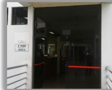
Sala de Ciencias