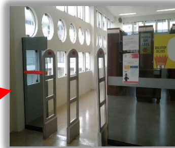
Sala de Humanidades