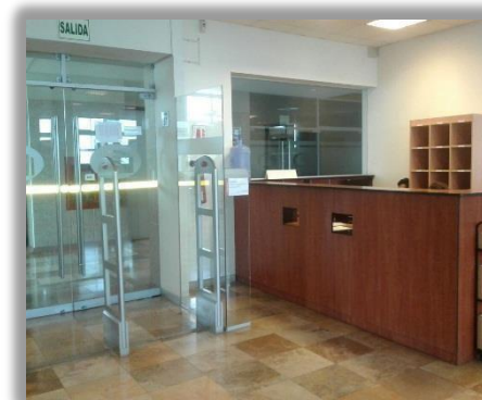
Sala de Ciencias de la Salud