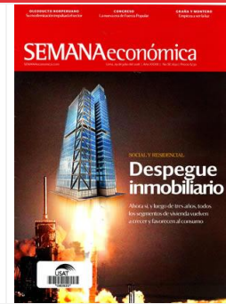
Semana económica. Vol.33 No.1630 (2018: jul.)