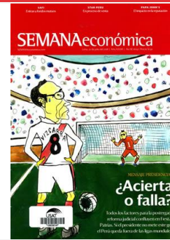
Semana económica. Vol.33 No.1629 (2018: jul.)