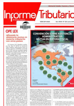
Informe tributario. Vol.27 No.325 (2018: jun.)