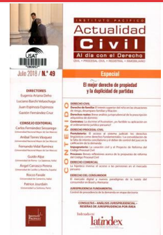
Actualidad civil. No.49 (2018: jul.)