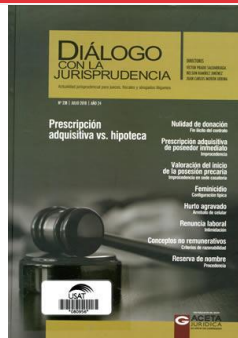
Diálogo con la jurisprudencia. Vol.24 No.238 (2018: jul.)