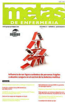
Metas de enfermería. Vol.21 No.06 (2018: jul.-ago.)