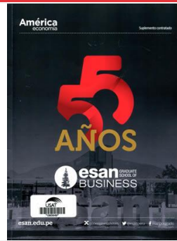
América economía Perú. No.122 (2018: jul.)-Spl.