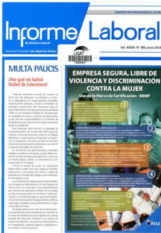
Informe laboral. Vol.33 No.389 (2018: jun.)