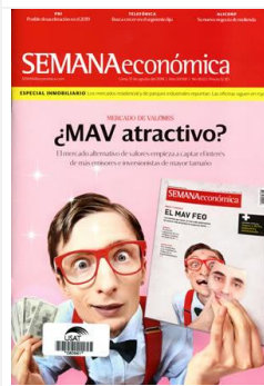
Semana económica. Vol.33 No.1632 (2018: ago.)