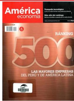
América economía Perú. No.122 (2018: jul.)