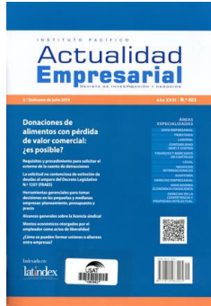
Actualidad empresarial. Vol.18 No.402 (2018: jul.)