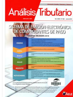
Análisis tributario. Vol.31 No.365 (2018: jun.)