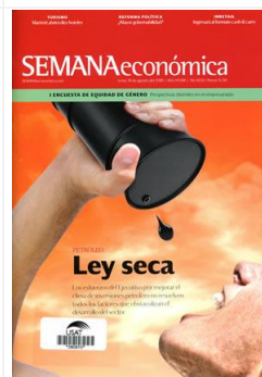
Semana económica. Vol.33 No.1633 (2018: ago.)