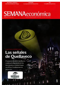
Semana económica. Vol.33 No.1631 (2018: ago.)